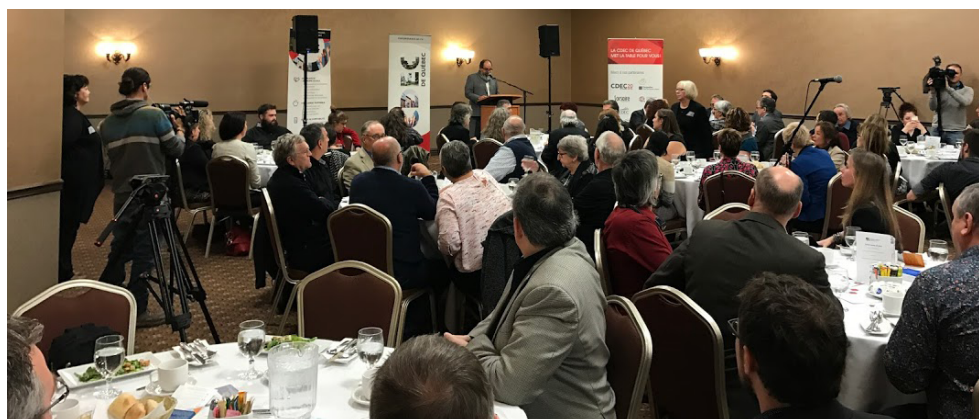
Le Dîner-conférence de la CDEC de Québec a réuni plus de 150 personnes à l'occasion des Semaines de l'économie sociale 2016.