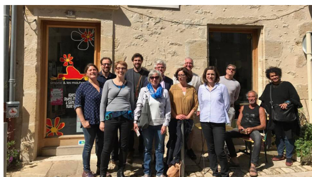
La délégation de la Capitale-Nationale en visite dans la Nouvelle-Aquitaine.